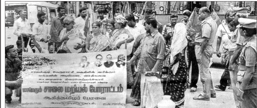
சாயல்குடியில் அடிப்படை வசதிகளை நிறைவேற்றாத பேரூராட்சியை கண்டித்து பேரவையினர் சாலைமறியல் போராட்டம் நடத்தினர்.

பைக்கில் வீட்டு போகிறேன் என்று அப்பாவிடம் சொல்லிவிட்டு வந்துள்ளார். பிறகு ரெயிலில் அடிப்பட்டு தற்கொலை செய்து கொண்டார் என அவர பெற்றோருக்கு தகவல் வருகிறது. தற்கொலை செய்து கொண்டால் உடல் துண்டு, துண்டாக போயிருக்கும் அல்லது உடல் முழு வதும் சிதைந்து போயிருக்க வேண்டும். அல்லது பல மீட்டர் தூரம் வீசப்பட்டிருக்க வேண்டும். அப்படி எதுவும் நடக்கவில்லை. அவரது தலையில் மட்டும் அடிப்பட்டு ரத்த கசிவு ஏற்பட்டு உள்ளது. எனவே இந்த இளவரசன் தற்கொலை செய்யவில்லை. யாரோ அடித்து கொலை செய்துள்ளனர். எனவே சாவில் மர்மம் இருக்கிறது எனவே இந்த வழக்கை சி.பி.ஐ விசாரணை நடத்த வேண்டும் என ஆதித்தமிழர் பேரவையின் சார்பாக கேட்டுக் கொள்கிறேன். இவ்வாறு அவர் பேட்டியளித்தார்.